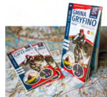
Mapa Gminy Gryfino dostępna jest nieodpłatnie w Centrum Informacji Turystycznej w Gryfinie

Od szosy w Nowym Czarnowie do Krzywego Lasu prowadzi czerwony turystyczny szlak.